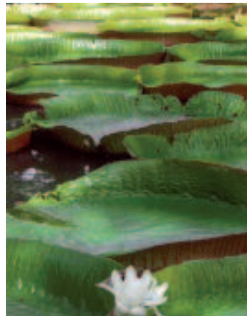
2n. Aroa Boza. Les Nymphéas